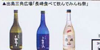
＜長崎県産酒の飲み比べ＞