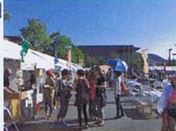
▲出島三角広場「長崎食べて飲んでみんね祭」