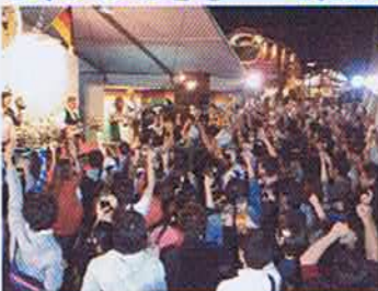
▲くら広場では「オータパーフェスト2013」開催!