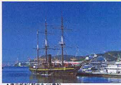
▲復元帆船「観光丸」に乗船

☆ご案内☆ 「観光丸」が強風等の 気象条件により運航 できない場合は、他 船による「港内めぐり」 と観光丸船内見学に 変更させていただきます。